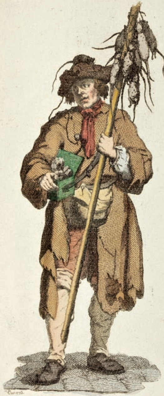
La mort aux rats mes Dames.